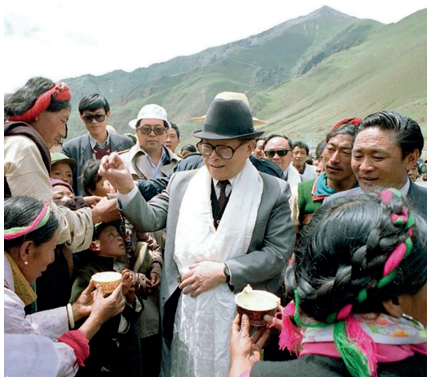
Рис. 4. Генеральный секретарь ЦК КПК Цзян Цзэминь во время визита

ского руководства. Он подчеркнул, что борьба с сепаратизмом как внутри страны, так и за рубежом должна осуществляться решительно и настойчиво. Следует всемерно развивать тибетскую экономику, в частности долину трех рек Ярлунг Цзанпо, Лхаса и Ньян Чу. Стратегически важным является развитие образования и науки в Тибете. Цзян Цзэминь также посетил храм Джокан (тиб. ཇོ་མང, кит. 大昭寺) на площади Баркор и дворец Потала.