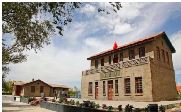
Рис. 2. Бывшее здание администрации, в котором ныне расположен музей

мерно 20 % ее населения: вторая народность после ханьцев (汉族) с долей более 50 %. Кроме того, около 10 % населения провинции составляла народность хуэй (回族), до 4 % народность ту (土族), и до 2 % народность салары (撒拉族).