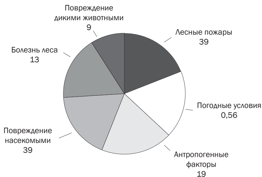
Рис. 4. Основные причины гибели лесов Китая в 2021 г. *, %

* Составлен авторами на основе данных: открытой статистики FAO : https://www.fao.org/statistics/ru/ .