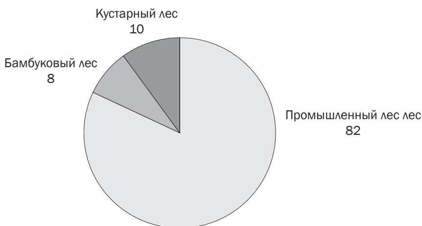
Рис. 2. Структура породного состава китайских лесов, % *